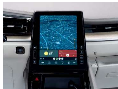
10,4-дюймовая многофункциональная информационно-развлекательная система