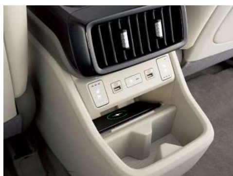
Заднее беспроводное зарядное устройство