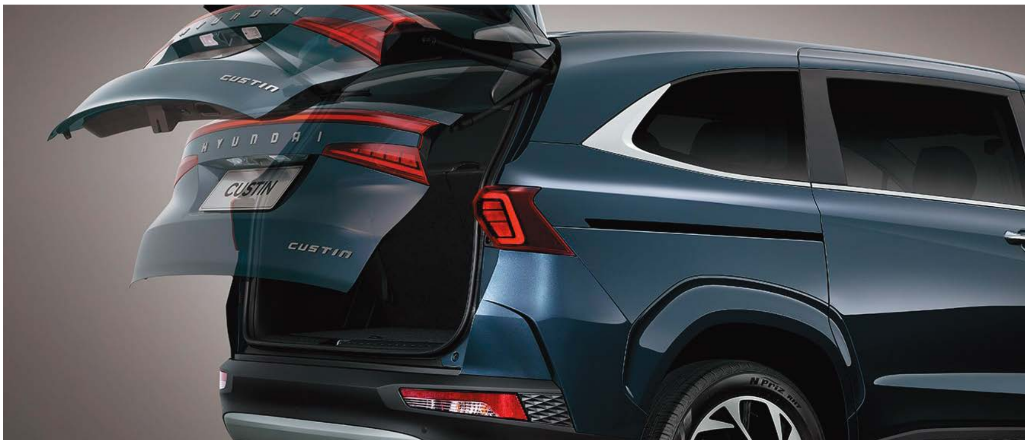
Дверь багажника с электроприводом