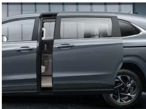
Сдвижные двери с электрприводом