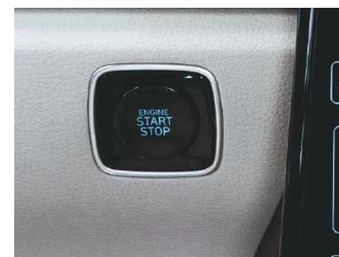
Система бесключевого доступа Smart Key и кнопка запуска двигателя