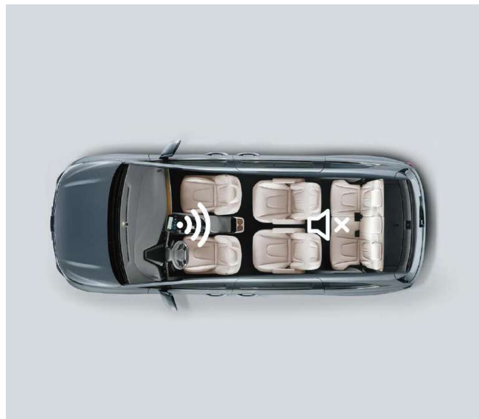
Отключение звука для второго и третьего ряда сидений

Вы можете отключить звук на втором и третьем рядах через экран мультимедийной системы, чтобы Ваша семья могла спокойно спать во время поездки.