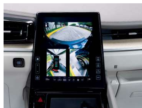
Система кругового обзора