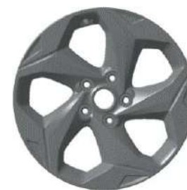
17-дюймовые легкосплавные колёсные диски