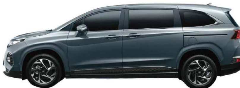
Общая длина 4 965 Колесная база 3 055