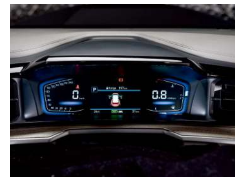
Полностью цифровая приборная панель с 4,2-дюймовым ЖК-дисплеем