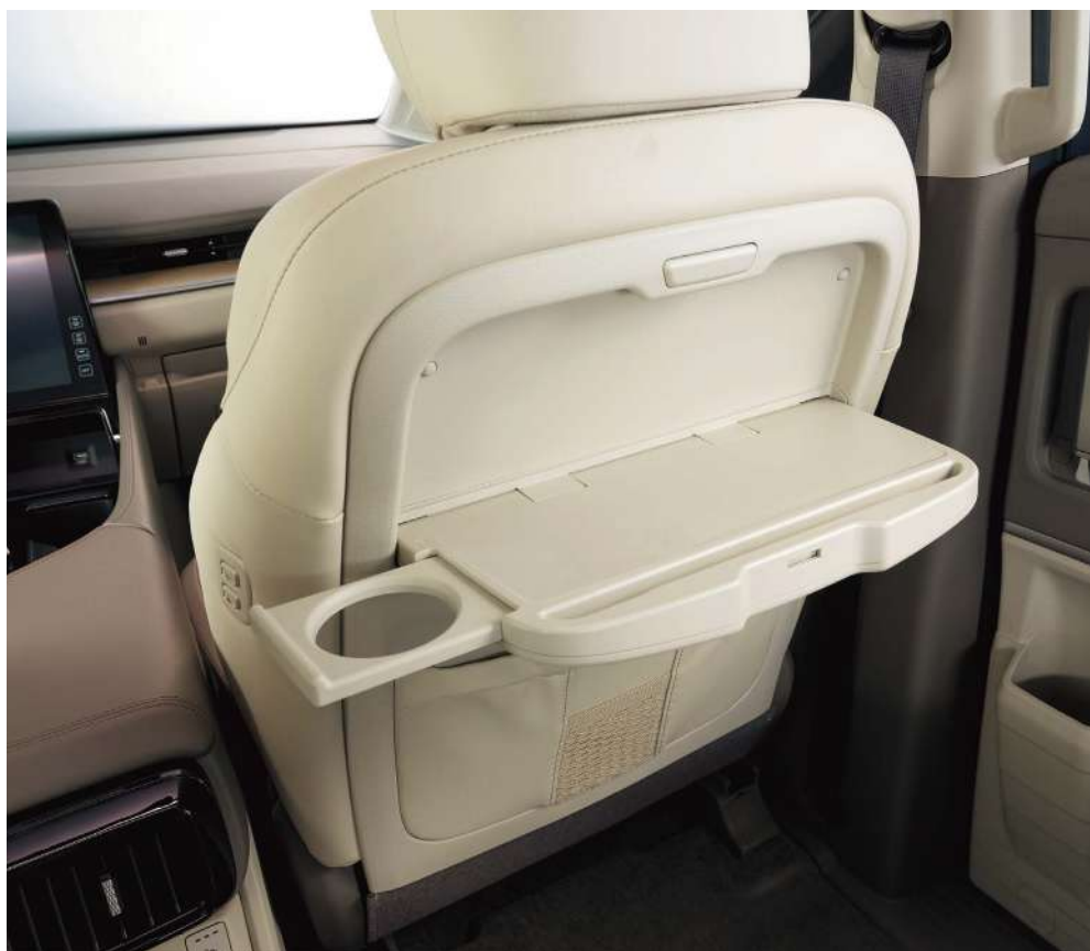
Складные столики на заднем сиденье с подставкой для планшета