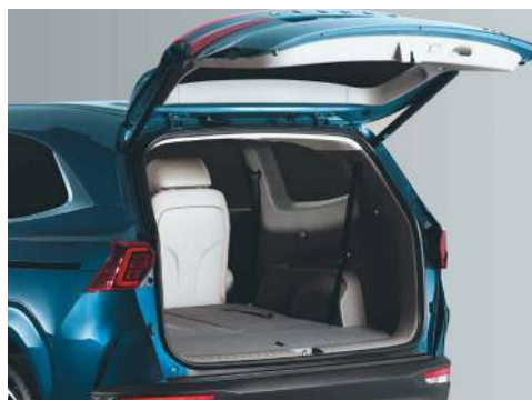
Дверь багажника с электрприводом