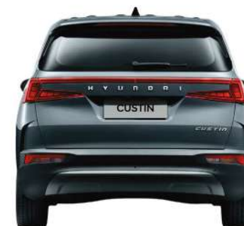
Ширина колеи* 1607/1635