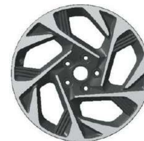
18-дюймовые легкосплавные колёсные диски