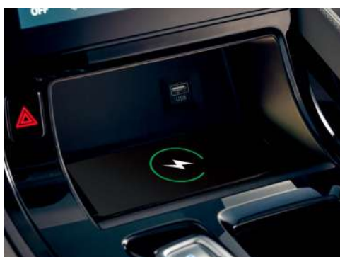
Переднее беспроводное зарядное устройство