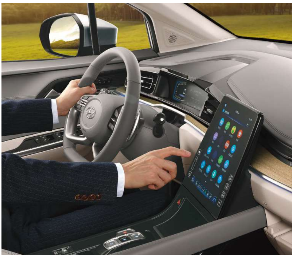
Центральный экран с диагональю 10,4 дюйма

Используйте интеллектуальные возможности управления, наслаждайтесь комфортом.